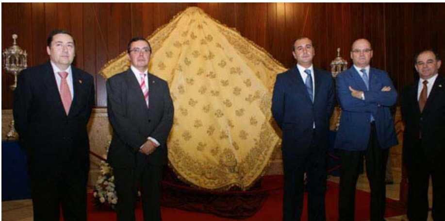
Presentación del manto en la tarde de ayer