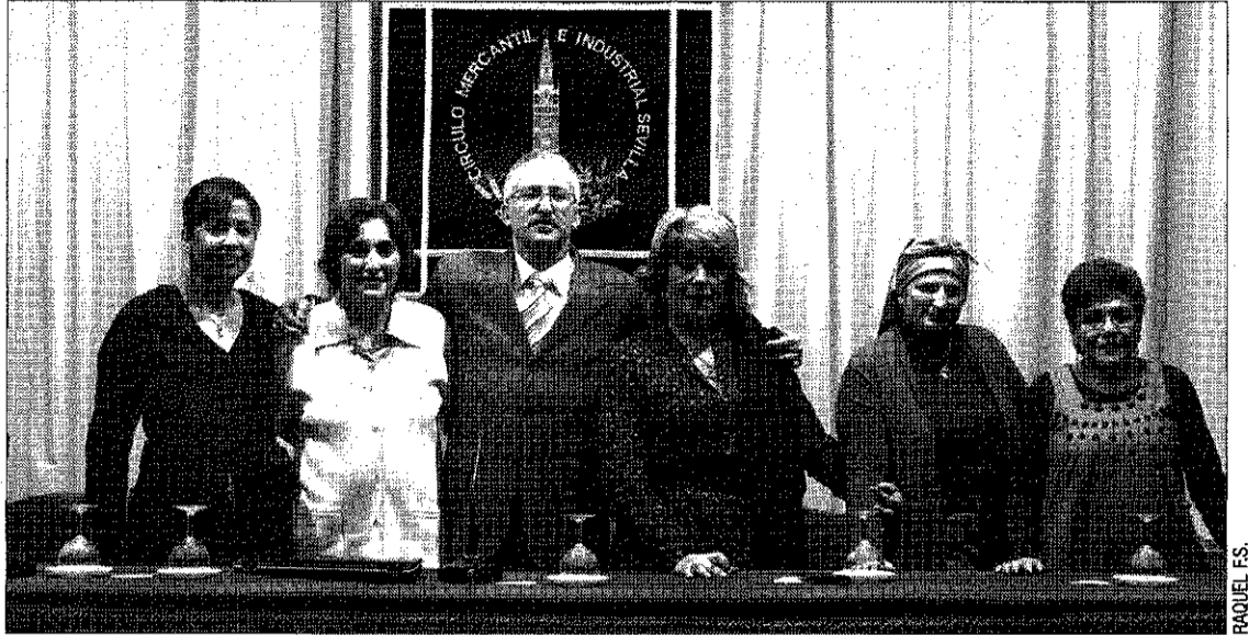
APOYO. La junta directiva de la asociación contó con el apoyo de muchos vecinos del barrio.

sepa más Si quiere conocer los estatutos, las actividades de la asociación o asociarse, visite su página web: www.mujeres-psj.es