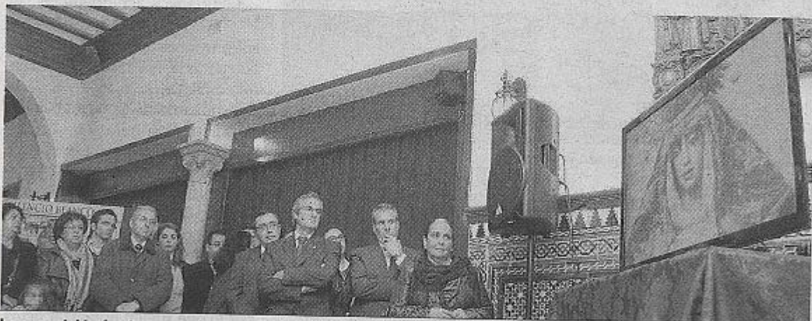
La exposición fue inaugurada ayer en el Círculo Mercantil de la calle Sierpes.

El Círculo Mercantil acoge una muestra sobre la Amargura