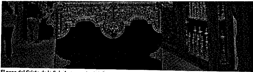
El paso del Cristo de la Salud se muestra totalmente montado en las nuevas dependencias.