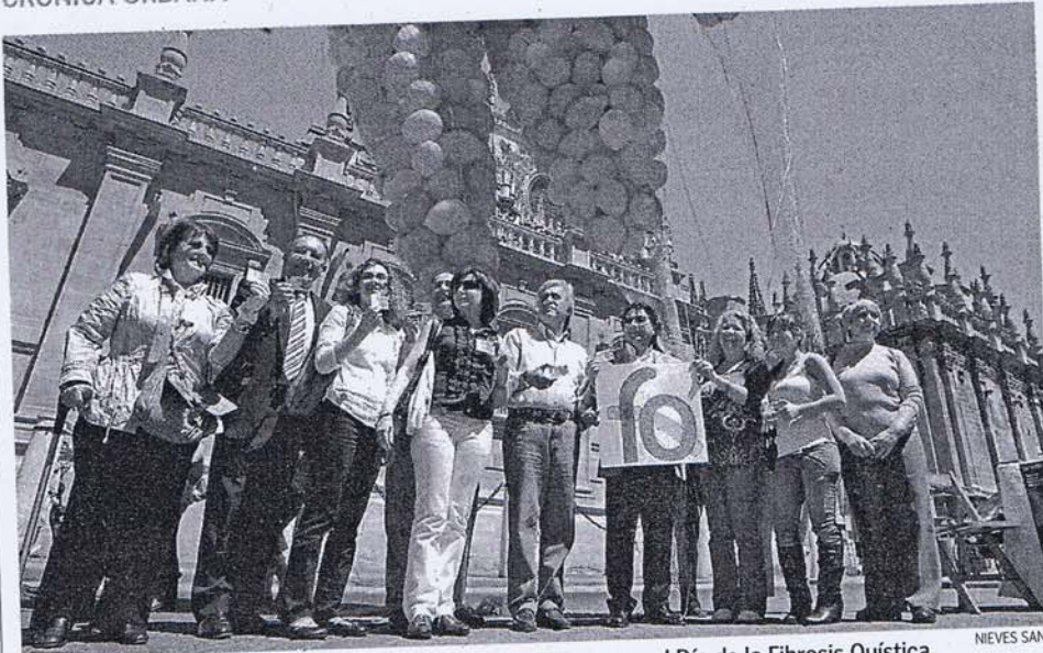
La suelta de globos es uno de los actos con que se conmemora el Día de la Fibrosis Quística