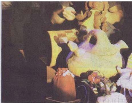
DESDE CUBA. Los titiriteros que actúan en la obra Papobo .