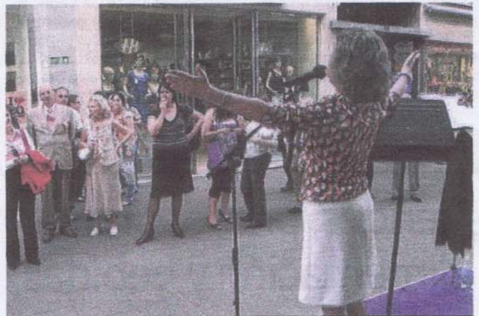
Música y recitales poéticos acompañaron la celebración.

Miembros de la asociación Farenheit 451 (Las Personas Libro) de Sevilla recitaron fragmentos